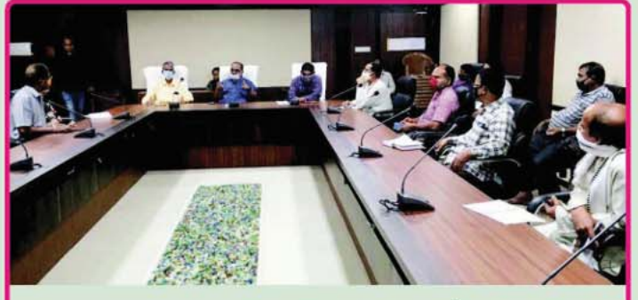
ତା. ୨୭.୧୦.୨୦ରେ ଶ୍ରୀମନ୍ଦିର ମୁଖ୍ୟ କାର୍ଯ୍ୟାଳୟ ଠାରେ 'ମୋ ଧାମ- ମୋ ପର୍ବ' କାର୍ଯ୍ୟକ୍ରମ ସମ୍ପର୍କିତ ବୈଠକ ।