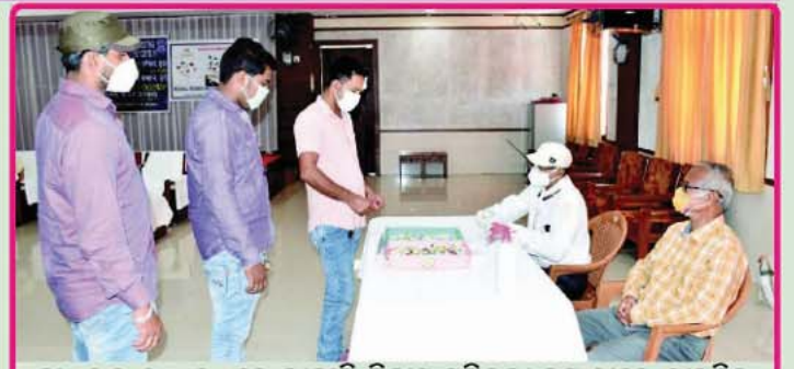
ତା. ୧୬.୧୦.୨୦ରେ ନୀଳାଦ୍ରି ନିବାସ ସମ୍ମିଳନୀ କକ୍ଷ ଠାରେ ଶ୍ରୀମନ୍ଦିର ପ୍ରଶାସନ ଏବଂ ଭାରତ ସରକାରଙ୍କ ଆୟୁଷ ମନ୍ତ୍ରାଳୟର ସହଯୋଗରେ ସେବାୟତ ଓ କର୍ମଚାରୀମାନଙ୍କ ପାଇଁ 'କରୋନା ରୋଗ ପ୍ରତିଶୋଧକ ଶକ୍ତି ବର୍ଦ୍ଧକ ହୋମିଓପଥିକ୍ ଔଷଧ ବଣ୍ଟନ ଶିବିର' ଅନୁଷ୍ଠିତ ହୋଇଯାଇଛି ।